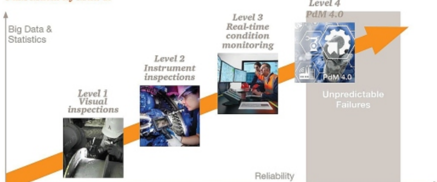
De vier niveaus van predictief onderhoud waarin de responderende bedrijven werden ingedeeld