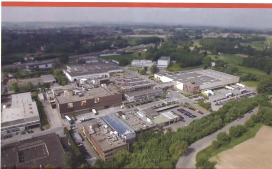
Puratos maakt middelen vrij om storingen te voorkomen via de uitbouw van preventieve onderhoudsplannen en het toevoegen van een reliability engineering functie

Puratos opereert in een vragende markt. Om aan de stijgende vraag te kunnen beantwoorden, moeten ook de productie-installaties kunnen volgen. Puratos werkt een traject uit waarbij er binnen de onderhoudsvisie, gefundeerd met het VDM-model, middelen vrijgemaakt worden om storingen te voorkomen via de verdere uitbouw van preventieve onderhoudsplannen en het toevoegen van een reliability engineering functie. Mainnovation begeleidt dit traject door in de beginfase de nodige opleidingen te voorzien voor het correcte gebruik van de RCM-methodiek, die gebruikt wordt door de nieuw aangeworven maintenance engineer om complete onderhoudsplannen op te stellen. Bovendien wordt de vooruitgang via jaarlijkse audits opgevolgd en