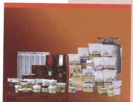
Puratos is een wereldwijde producent van ingrediënten voor brood- en banketbakkers en chocolatiërs

Door de positieve resultaten wordt in de andere vier Belgische vestigingen van Puratos momenteel gestart met hetzelfde proces onder begeleiding van Mainnovation.